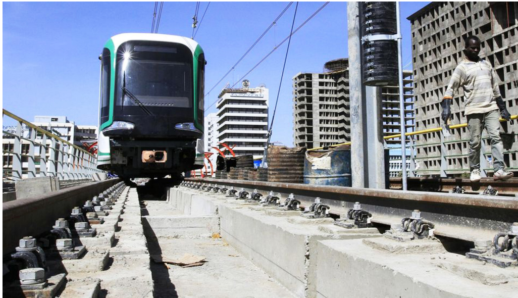
L'Éthiopie a inauguré sa première ligne de métro urbain à Addis-Abeba le 20 septembre 2015